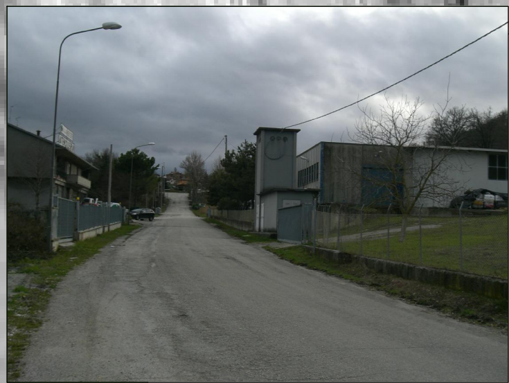
Polo industriale Ca del Vento