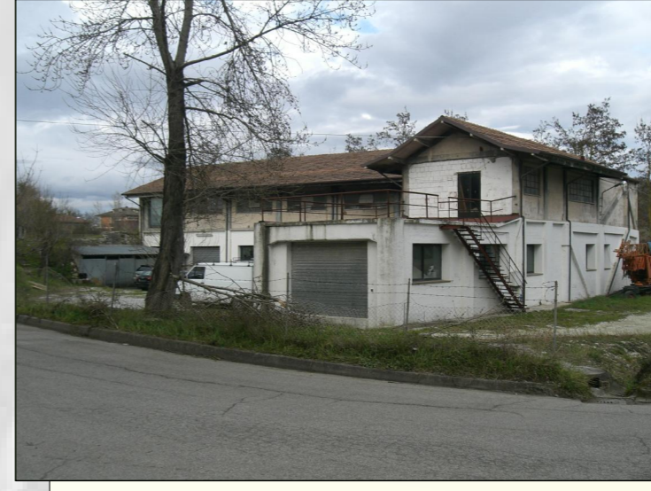
Teleferica e parcheggio Lovea