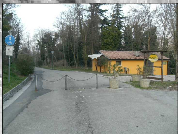
Ponte per Matolo