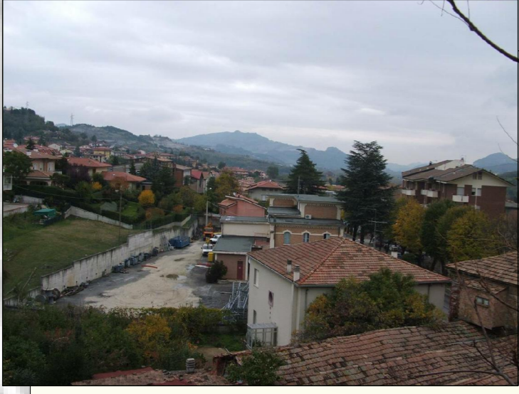
Area Enel e aree limitrofe Scuola Elementare

I luoghi inespressi sono quei luoghi in cui l'attività umana è "sospesa". Con l'aggettivo "sospesa" si indica l'abbandono di un'attività, in attesa di un utilizzo migliore, oppure il non utilizzo legato alla casualità o legato ad esigenze di immediata necessità non affini con il luogo stesso. Bisogna offrire a questi siti la possibilità di dispiegarsi per non essere più considerati luoghi in cui è difficile posare un nome.