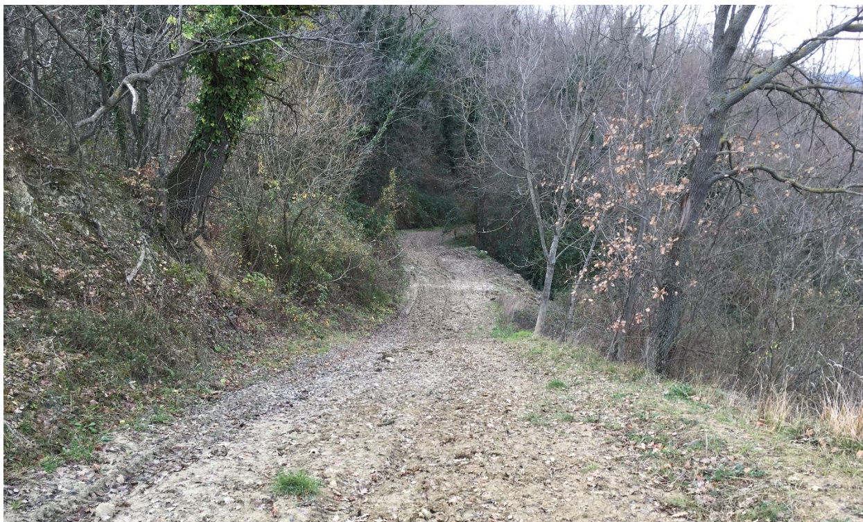
primo tratto – 150m

Per il secondo tratto di circa 200m sono previste opere di decespugliamento laterale per pulizia vegetazione infestante e piccola sistemazione del sedime con ripristino fossi di scolo e l'asportazione di eventuale pietrame incongruo.