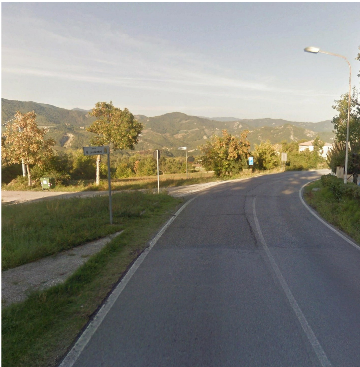
tratto da Parco G. Laurentini a Loc. Ca' Sartini

1.24. Realizzazione camminamento lungo la S.P. 8 Via Santagate, a partire dal Parco G. Laurentini fino all'incrocio con Loc. Barberini, per una lunghezza complessiva del tratto interessato di circa 90m + 10m. Le opere previste sono la formazione di banchina lato strada in misto stabilizzato cementato (lato sinistro della S.P. 8, a scendere in direzione Sarsina) per l'intero tratto ed interventi di ingegneria naturalistica per sostegno del terreno (mediante infissione di pali di castagno ed elementi trasversali) sul tratto da Loc. Ca' Sartini a Loc. Barberini, per una lunghezza di circa 90m.