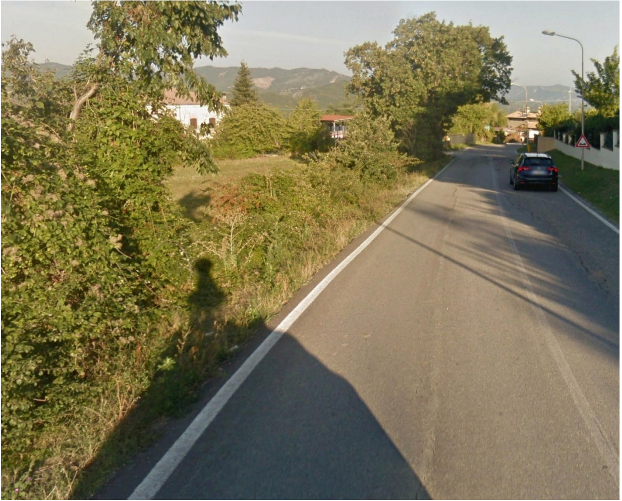
tratto da Loc. Ca' Sartini a Loc. Barberini