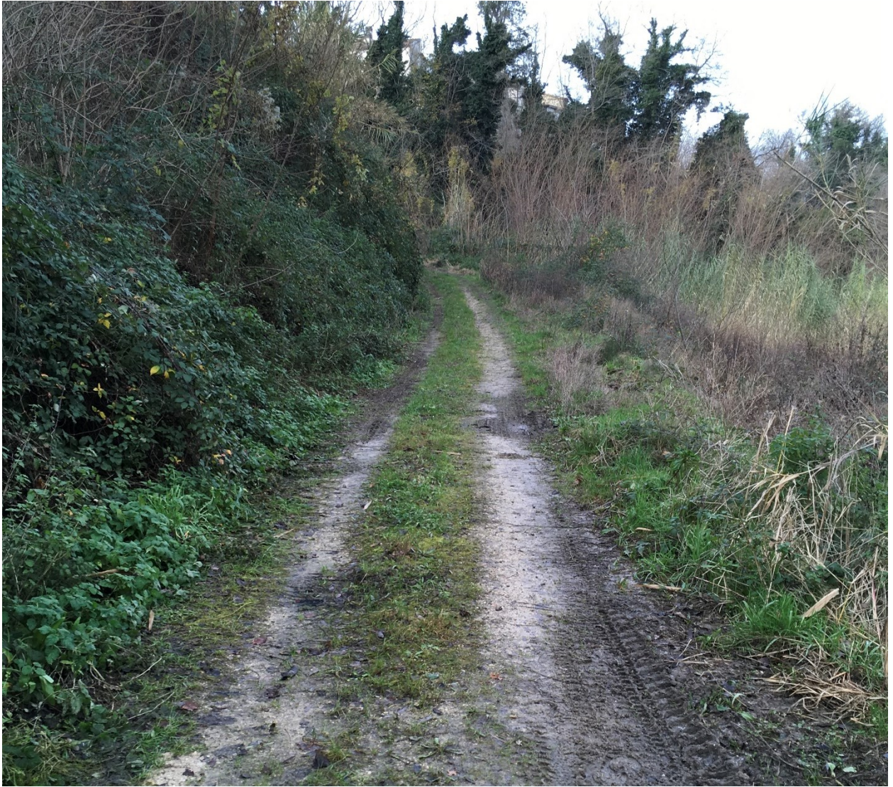
secondo tratto – 200ml